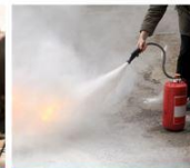
Equipo de intervención