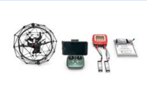
Prevención de R.Laborales en el uso de Baterías LiPo - 1,5 horas