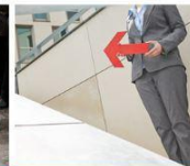
Equipo de alarma y evacuación