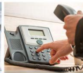
Centro de control