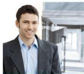
Jefe de emergencia