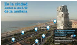
En la ciudad Lunes a las 8.40 de la mañana Cambio de hábitos sobre movilidad. Casos prácticos de seguridad vial - 4 horas