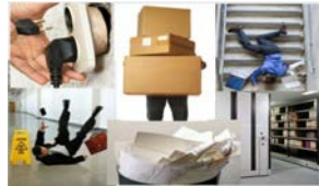
Seguridad y salud en trabajos de oficinas - 2 horas