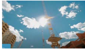
Protégete del sol en el trabajo 1 hora