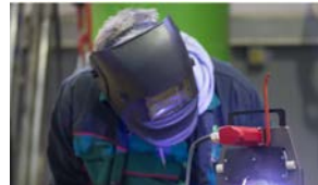
Seguridad y salud en la industria 2 horas