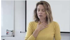
Cuidado de la voz - 2 horas