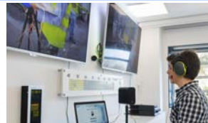
Prevención ante el ruido 2 horas