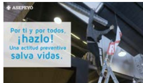
Por ti y por todos, ¡hazlo! Una actitud preventiva salva vidas. Tres niveles: 30 min. / 1h / 2 h