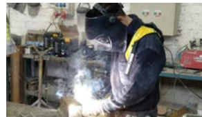
Prevención de riesgos con productos químicos 2 horas