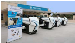
Seguridad vial - 2 horas